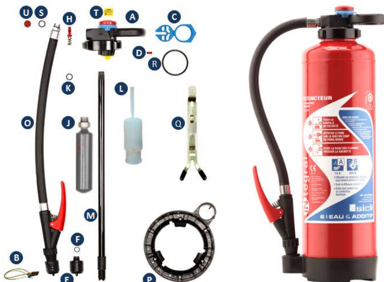
Date de fabrication : voir impression sur le réservoir