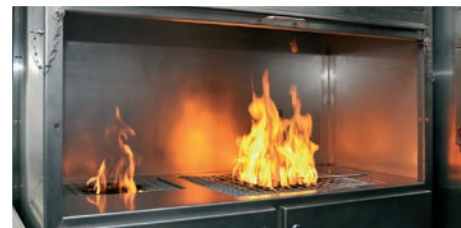
Feux de sorbonne