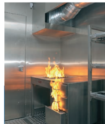
Feux de bureau