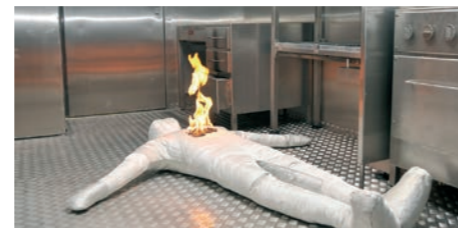
Feux de personne