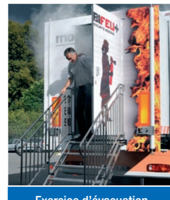
Exercice d'évacuation en zone enfumée

MOBIFEU+ vous propose plus d'ergonomie pour accueillir 15 personnes dont une personne à mobilité réduite :