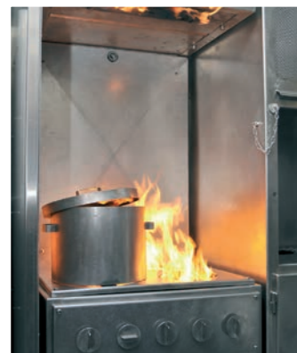
Feux de cuisine