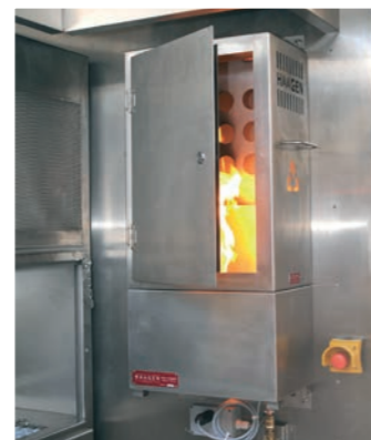
Feux d'armoire électrique