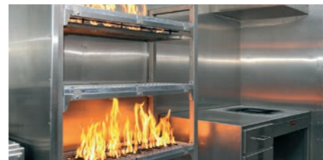
Feux de stockage