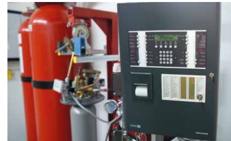
KD-1230 Löschanlage mit einer Hekatron EvoxX Brandmelder- und Löschsteuerzentrale